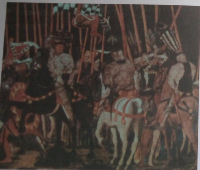
П. Уччелло. Битва при Сан-Романо. Фрагмент. Масло

Такие картины помогают нам узнавать свою историю, своё прошлое, и поэтому они называются исторические картины.