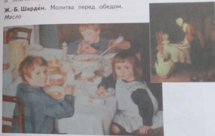
3. Серебрякова. За обедом. Масло